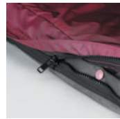
Cremallera para la Cubierta