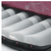
Celdas de PU