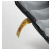
Válvula CPR para emergencias